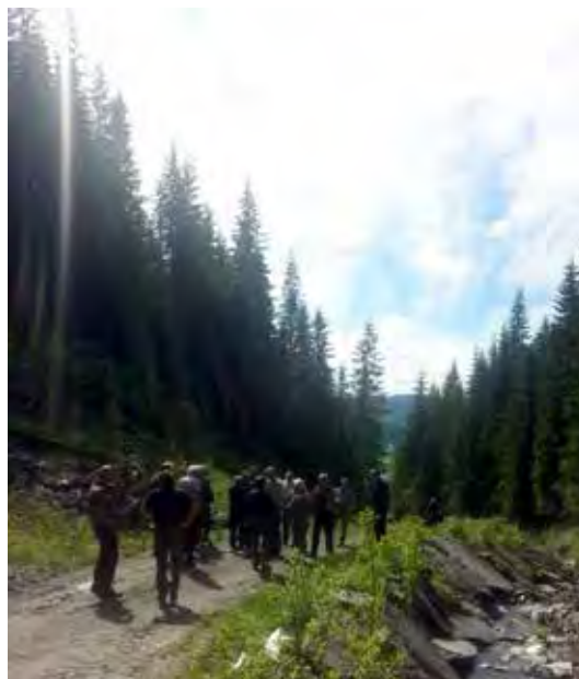
TRØNDELAG: Skogsveger var et av temaene på årsmøte-utferden.