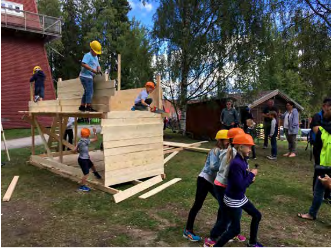
TØFF: Med hjelm på hodet blir man straks en proff snekker og kan enten gyve løs på jobben eller posere for fotografen.