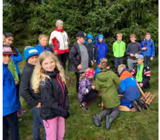
OPPLAND: Elever fra 6. klasse i Vestre Slidre kommune fikk en lærerik skoledag ute i det fri.