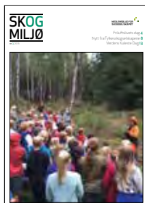
Forsidefoto: Skoleskogdag ved Sognsvann i Oslo.