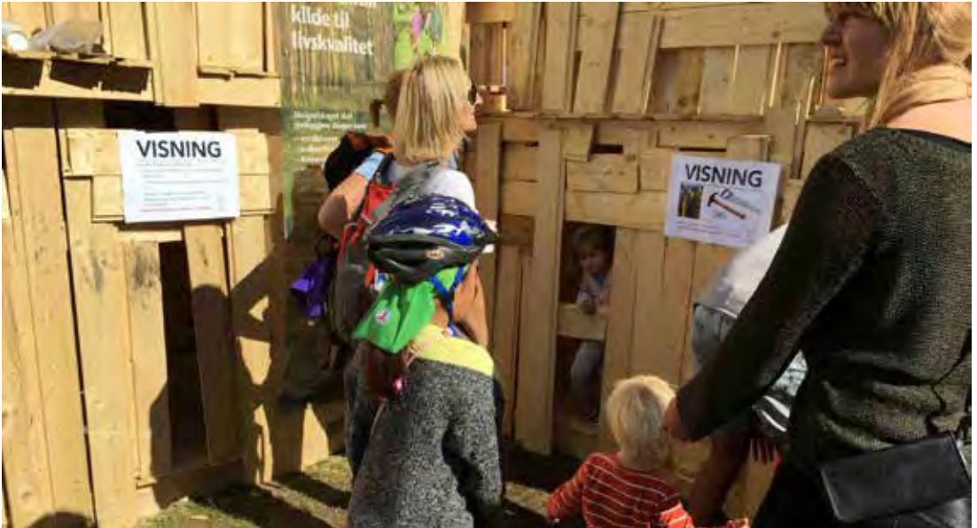
TITTEL: Når man går på visning, må man utforske alle kroker og kriker. På Friluftslivets dag ble ferdigsnekret plankehytte fra skoleskogdagene vist fram for publikum.