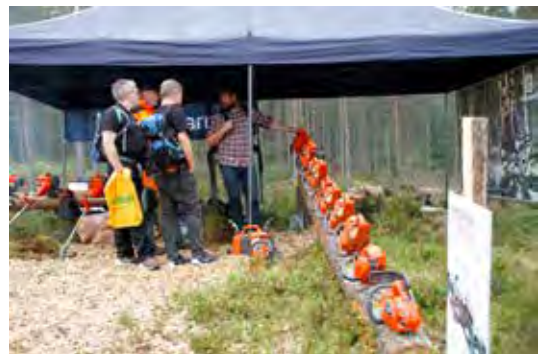
PÅ REKKE OG RAD: Mange motorsagmodeller å velge mellom på Husqvarnas stand.

Skogselskapet grillet burgere og pølser og solgte mat og drikke til alle besøkende. I tillegg hadde Maskinentrepenørenes forening bestilt to helstekte reinsdyr som skulle serveres på entreprenørmiddagen om kvelden, noe som Skogselskapet selvfølgelig tok på strak arm. 480 personer fikk servering i løpet av en halvtime.