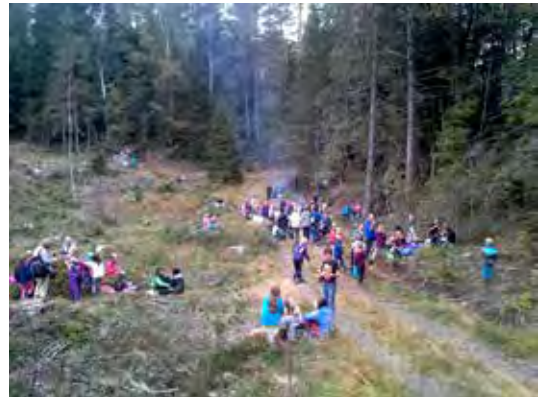
AGDER: Elever fra Froland og Nesheim har deltatt på skoleskog-dager i regi av Skogselskapet.

med spikking og andre aktiviteter. Det var nesten fullt av barn på standen hele helga, og innimellom var det kø. Ungene spikket og produserte nesten like mye flis som fliskutteren som var en del av standen. Ellers var