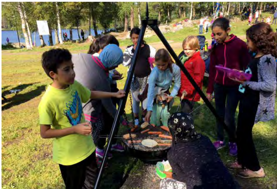
NISTE: Det ble varm lunsj på Oslo-elevene som deltok på Skoleskogdagene på Sognsvann i august.

Arrangørene kunne etter arrangementet konstatere at også flere lærere hadde godt læringsutbytte av skoleskogdagene. Fotosyntesen med CO 2 -fangst, karbonlagring og produksjon av oksygen er dessverre for mange lærere ukjent. Mange hadde også godt utbytte av å høre om hvilke produkter vi får fra trær.