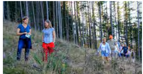
ROGALAND: Ulike skogtypar og utviklingsstrinn ble besøkt på utferda.