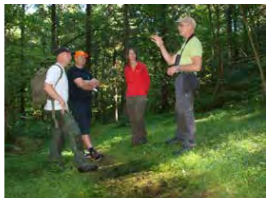
AGDER: Skogselskapet har hatt besøk av Det norske Skogfrøverk og var med på befaring på Lyngdal frøplantasje som ligger på Skogselskapets eiendom i Agder.