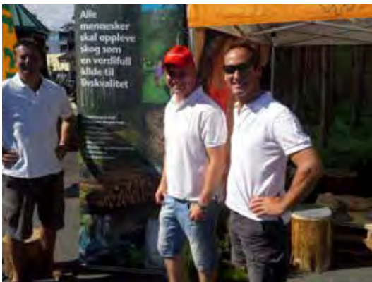
AGDER: Skogselskapet deltok på Arendalsuka sammen med DnS og AT Skog.