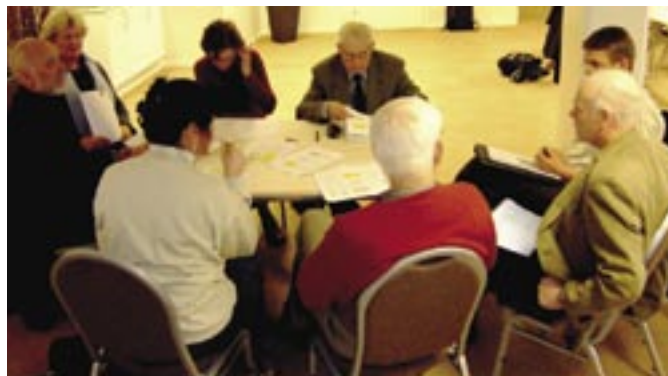
Fra gruppediskusjon under lederkonferansen i april.

Vinterens arbeid har resultert i at prosjektet ikke har funnet å kunne anbefale en full samorganisering mellom DnS og SKI nå. Grunnen til dette er både at SKI har vært tydelige på at veien mot samorganisering bør gå via en periode med tettere og mer forpliktende samarbeid og felles opp-