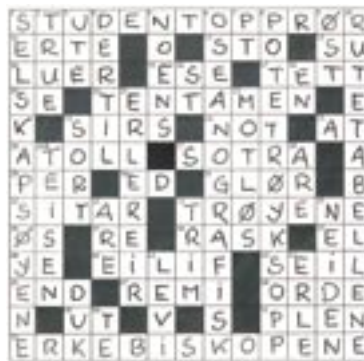
Løsning nr. 1/07